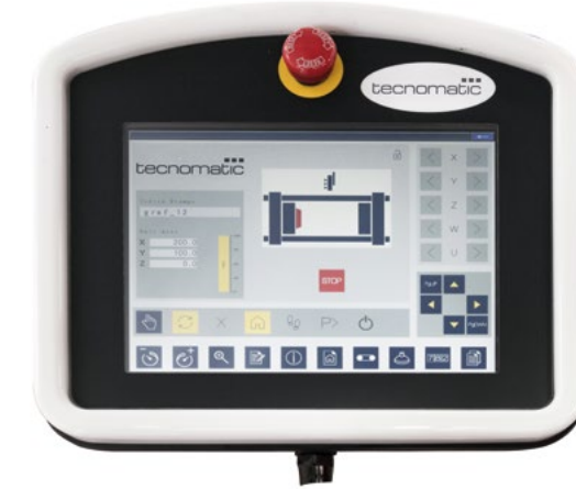
Tastiera di programmazione / Remote programmable keypad / Programmierkonsole