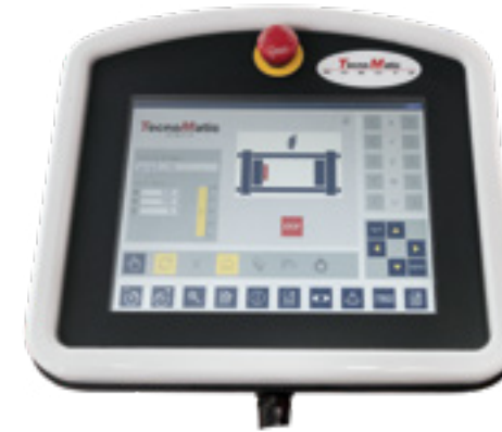
Tastiera di programmazione Remote programmable keypad Programmierkonsole