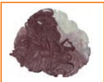
Example of lumps Esempio scarto triturabile