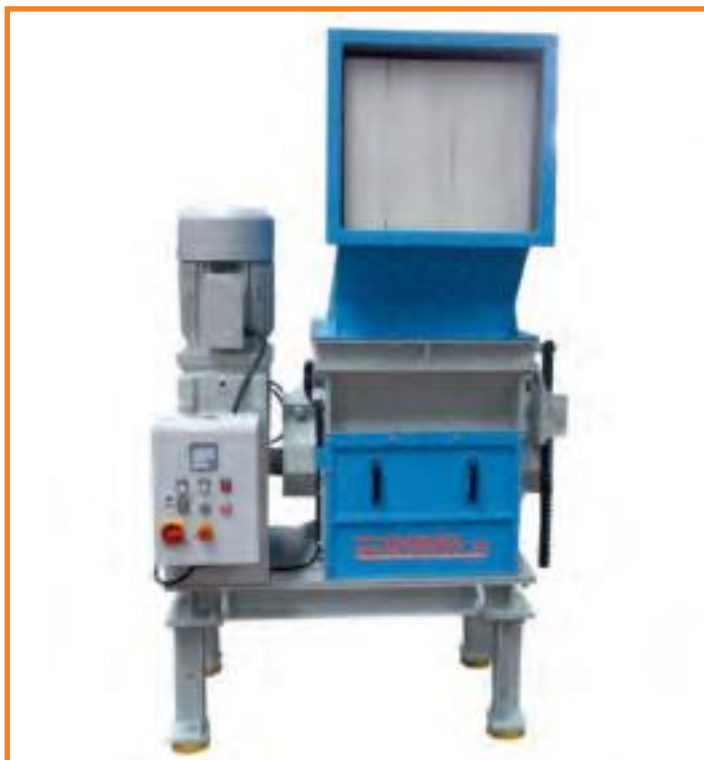
Detail: GVT 520/310 Rotor Particolare: Rotore GVT 520/310