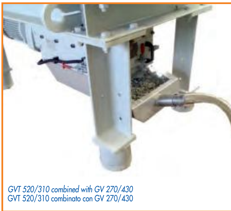
GVT 520/310 combined with GV 270/430 GVT 520/310 combinato con GV 270/430